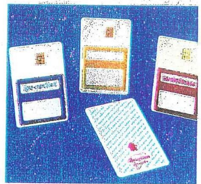
La chip-card, la scheda di memoria delle macchine da cardiofitness della Profit.

il grado per ogni frequentatore. La carta determina poi i necessari parametri allenanti, opportuni per ognuno, dispensando l'allenatore dalla riprogrammazione degli stessi, operazione che si renderebbe invece necessaria in assenza di questo dispositivo. Utilizzando la consolle computerizzata, l'istruttore può comunque generare programmi di allenamento personalizzati che rimangono in memoria e che possono essere utilizzati da singoli soggetti o da gruppi omogenei. Inoltre l'esame degli esercizi può essere fatto in qualsiasi momento, anche se non coincidente con quello di esecuzione: l'istruttore può quindi verificare con comodità l'andamento del lavoro svolto dall'utente e certificarlo. Con altrettanta comodità l'utente preleva la propria chip card dalla reception e la inserisce nella macchina per impostare l'allenamento. Il test iniziale viene inoltre periodicamente ripetuto e la chip-card è in grado di aggiornare in modo automatico i valori dell'allenamen-